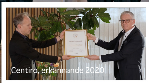
Centiro, erkännande 2020